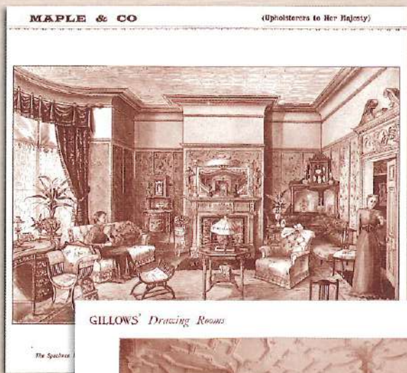
MAPLE & CO

家具の多様性は、大量生産と機械化がまだ不十分で、熟練職人による組み立てと仕上げによる自社製造であったにもかかわらず、今日よりもはるかに多くの種類がありました。ただ、その製造も徐々に低賃金の工場（多くはイーストエンドの）に下請けに出すようになっていったのでした…。