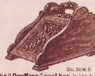
No. 3136 E The "Geoffrey" coal box, in hand-tooled carved mahogany oak, with lining and hand scoop complete, 28s. 6d. 39s. 6d. 45s. 0d.