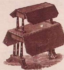
No. 1079 E Double 5 o'clock walnut or ebonized Sutherland tea table ... £1 12 6 Ditto black and gold ... 2 4 6 Ditto in burr walnut, inlaid ... 2 12 6 Top measures when open 22 by 20 in. Lower part, 39 by 24; total height 30 in.

Part 3のカタログを製作した Harrodsは19世紀半ばに Charles Henry HarrodがロンドンのBrompton Roadに開いた小さな雑貨店から始まり、やがてロンドン最大の最も有名で豪華な百貨店へと発展した。今はQuatar Holdingsの所有となっている。Harrodsの家具部門は、時には有名な食品部門や服飾部門をしのぐほど、一貫して最も高い利益を上げる部門のひとつであったと言われている。