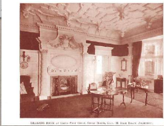
DRAWING ROOM AT 57 AND 59, CROSS STREET, BIRMINGHAM, GILLOWS, III, BANK BUILDING, ARCHITECTS.