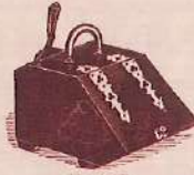
No. 3135 E Black and brass coal scoop, with lining and hand scoop complete. 3s. 6d. 2s. 0d. 7s. 6d. 9s. 6d. 11s. 6d.