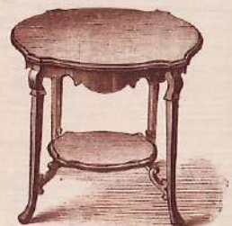
No. 1080 E Occasional table, with shaped top and undershelf, in dark mahogany or walnut, 2 ft. 0 in. ... £1 12 6