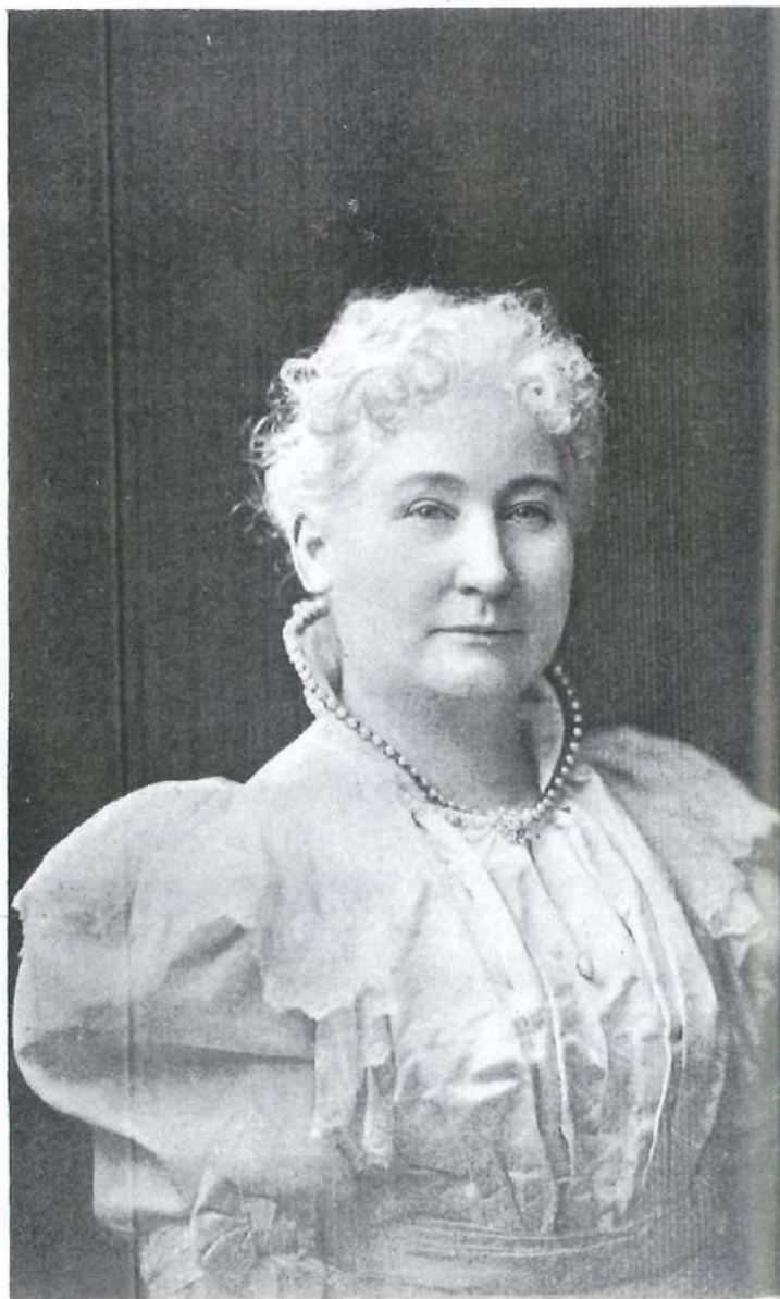
May Wright Sewall